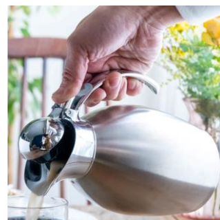
ワンプッシュで簡単に注げます