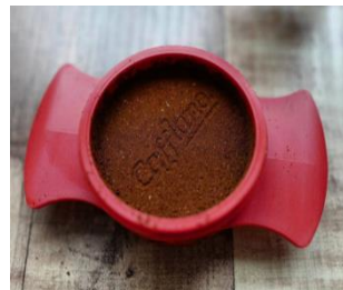
コーヒー豆をすくう タンピングスcoop

フィルターバスケットの豆をタンピングスcoopで押すとCafflanoの文字が浮かぶ